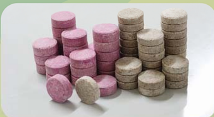
TANAMAN MENGHASILKAN (TM)