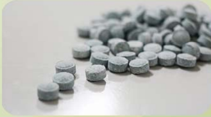
BIBIT PRE NURSERY (PN)