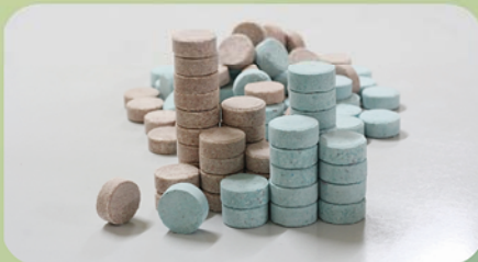
TANAMAN BELUM MENGHASILKAN (TBM)

Dosis per polybag : 100 gram / polybag Cara pemberian : Ditaburkan rata sekeliling bibir polybag Saat pemberian : Setelah transplanting dari PN ke MN