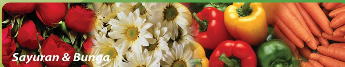
Sayuran & Bunga